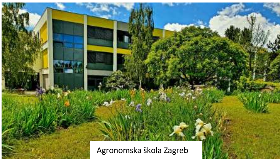
Agronomski škola Zagreb

Dopušteno je miješanje učenika različitih razrednih odijela tijekom izvođenja izborne nastave, nastave stranih jezika, fakultativne nastave, dodatne i dopunske nastave te izvannastavnih aktivnosti.