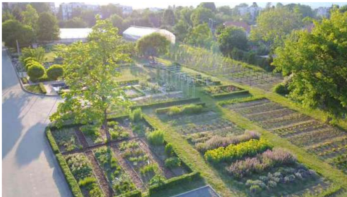
Školski vrt - učionica na otvorenom