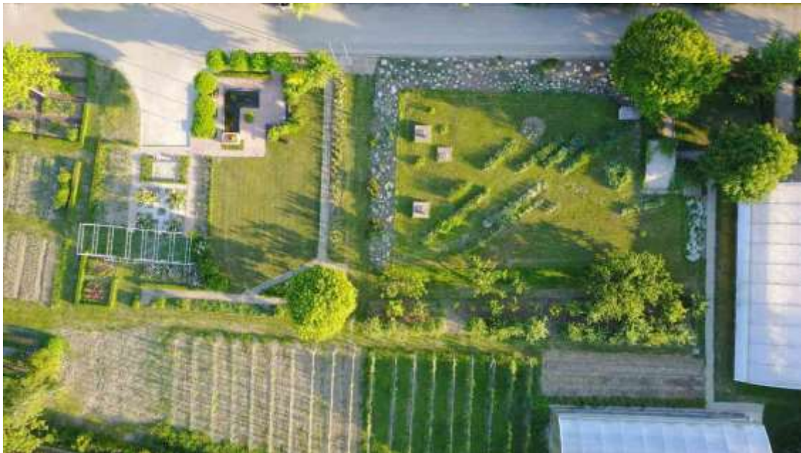
Školski vrt – učionica na otvorenom

Školski kurikulum dostupan je na mrežnim stranicama škole svim učenicima, roditeljima i svima zainteresiranim za rad i život naše škole.