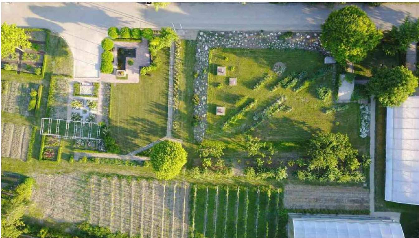
Školski vrt – učionica na otvorenom