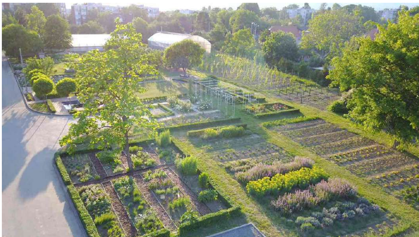
Školski vrt - učionica na otvorenom